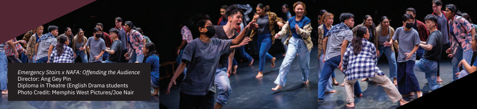
Emergency Stairs x NAFA: Offending the Audience Director: Ang Gey Pin Diploma in Theatre (English Drama students)